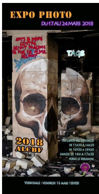
100 flyers H20x10cm sans « vernissage...18H00 »