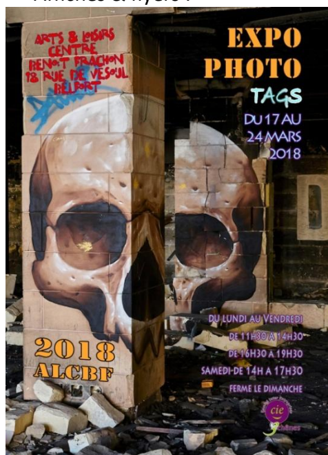
50 Affiches H42x30cm